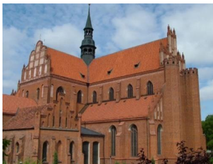
Bazylika w Pelplinie