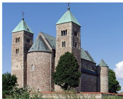
Kolegiata w Tumie